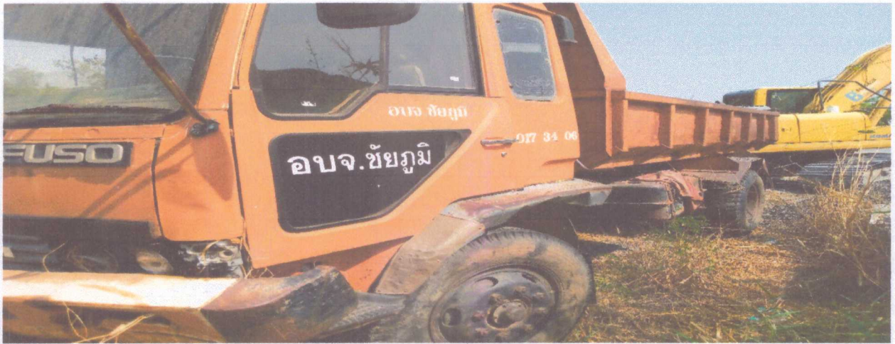
ลำดับที่ ๑ รถบรรทุกส่วนบุคคล กระบะบรรทุก (แบบยกได้) เลขทะเบียน ๘๒-๑๕๒๖ ชัยภูมิ